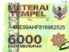
PUSPITA TRIANGGRAINI NPM : 16210056