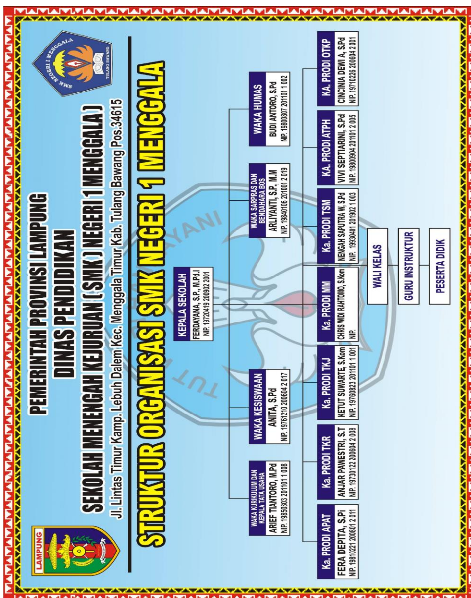
Gambar 15. Struktur organisasi

struktur organisasi adalah suatu gambar yang menggambarkan tipe organisasi, pendepartemenan organisasi kedudukan, dan jenis wewenang pejabat, bidang dan hubungan pekerjaan, garis perintah dan tanggung jawab, rentang kendali dan sistem pimpinan organisasi.