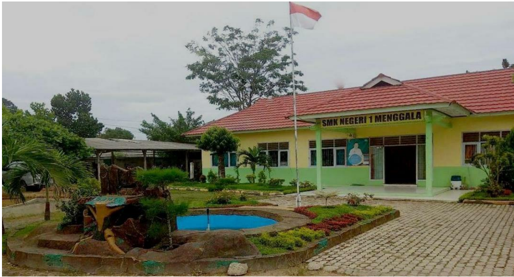
Gambar 13. Sekolah SMK Negeri 1 Menggala