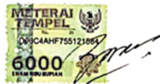
Bilowo Setya Nugraha