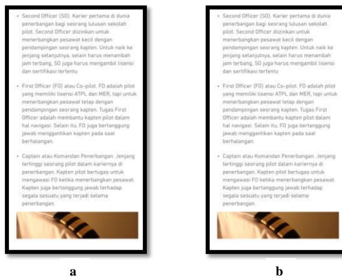
Gambar 4. (a). Typo sebelum revisi dan (b). Typo sesudah revisi