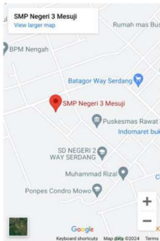
Gambar 1. Denah Lokasi Penelitian

Lokasi penelitian yang peneliti ambil adalah di SMP Negeri 3 Mesuji yang terletak di Jalan Gajah Mada, Kecamatan Way Serdang, Kabupaten Mesuji, Lampung.