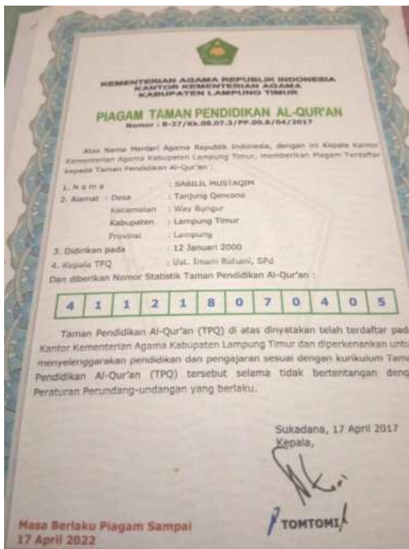
Gambar 3. 1