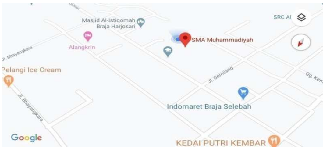
Gambar 2. Peta lokasi SMA Muhammadiyah Braja Selebah https://maps.app.goo.gl/vQqQ2UbcPsCDthkq7

Muhammadiyah Braja sebelah dibawah naungan Majelis Dikdasmen Muhammadiyah BrajaSelebah.