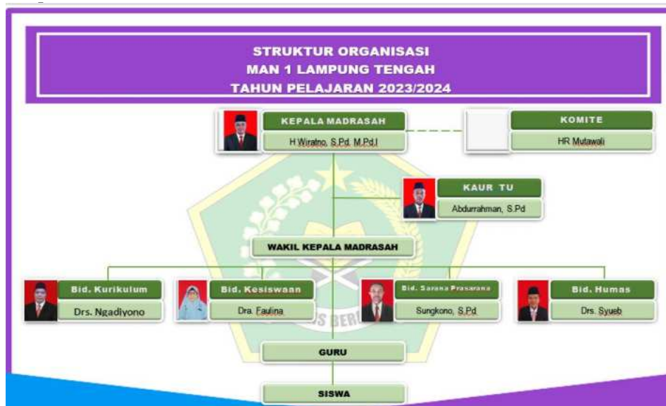
Gambar 2. Struktur Organisasi MAN 1 Lampung Tengah