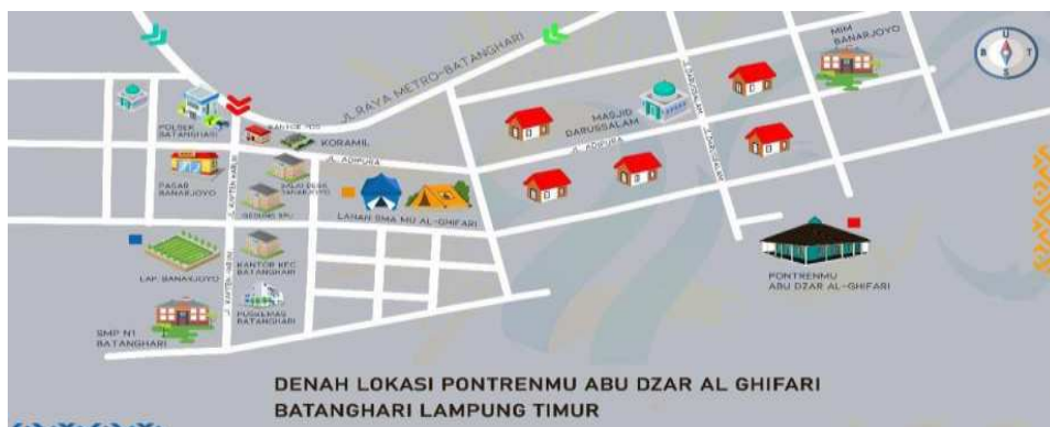
Gambar 2. Denah Lokasi Pondok Pesantren Muhammadiyah Abudzar Al-Ghifari Batanghari Lampung Timur 4

memiliki denah lokasi sendiri. Berikut di bawah ini merupakan denah lokasi Pondok Pesantren Muhammadiyah Abudzar Al-Ghifari Batanghari Lampung Timur pada Tahun Ajaran 2024/2025.