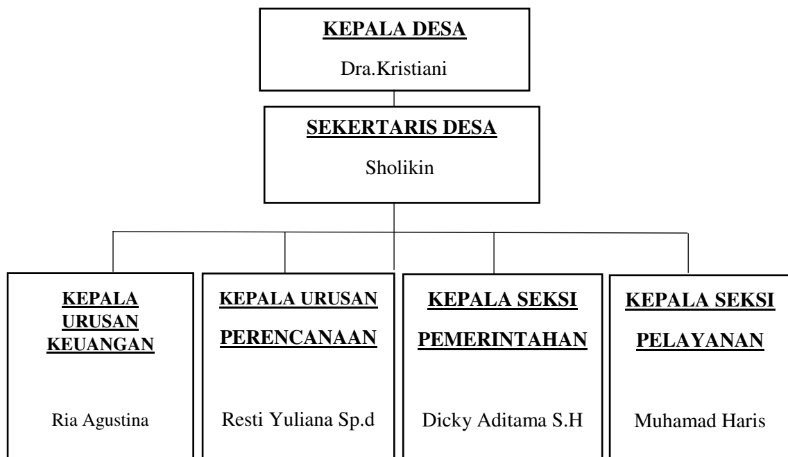
Gambar 2. Struktur Organisasi Desa Tatakarya Kecamatan Abung Surakarta Kabupaten Lampung Utara.

Struktur organisasi ialah faktor yang tidak kalah pentingnya didalam menentukan dan mengkaji bagaimana suatu organisasi beroperasi didalam menjalankan fungsi dan tanggung jawab tiap serta didalam pembagian tugas berlandaskan spesialisasi yang ada pada akhirnya menggambarkan adanya saling ketergantungan diantara bagian dan sub bagian didalam suatu organisasi. Berikut ini ialah struktur organisasi Desa Tatakarya Kecamatan Abung Surakarta Kabupaten Lampung Utara sebagai berikut: 10