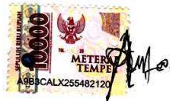
DIAN AJENG SAFITRI NPM: 19250018