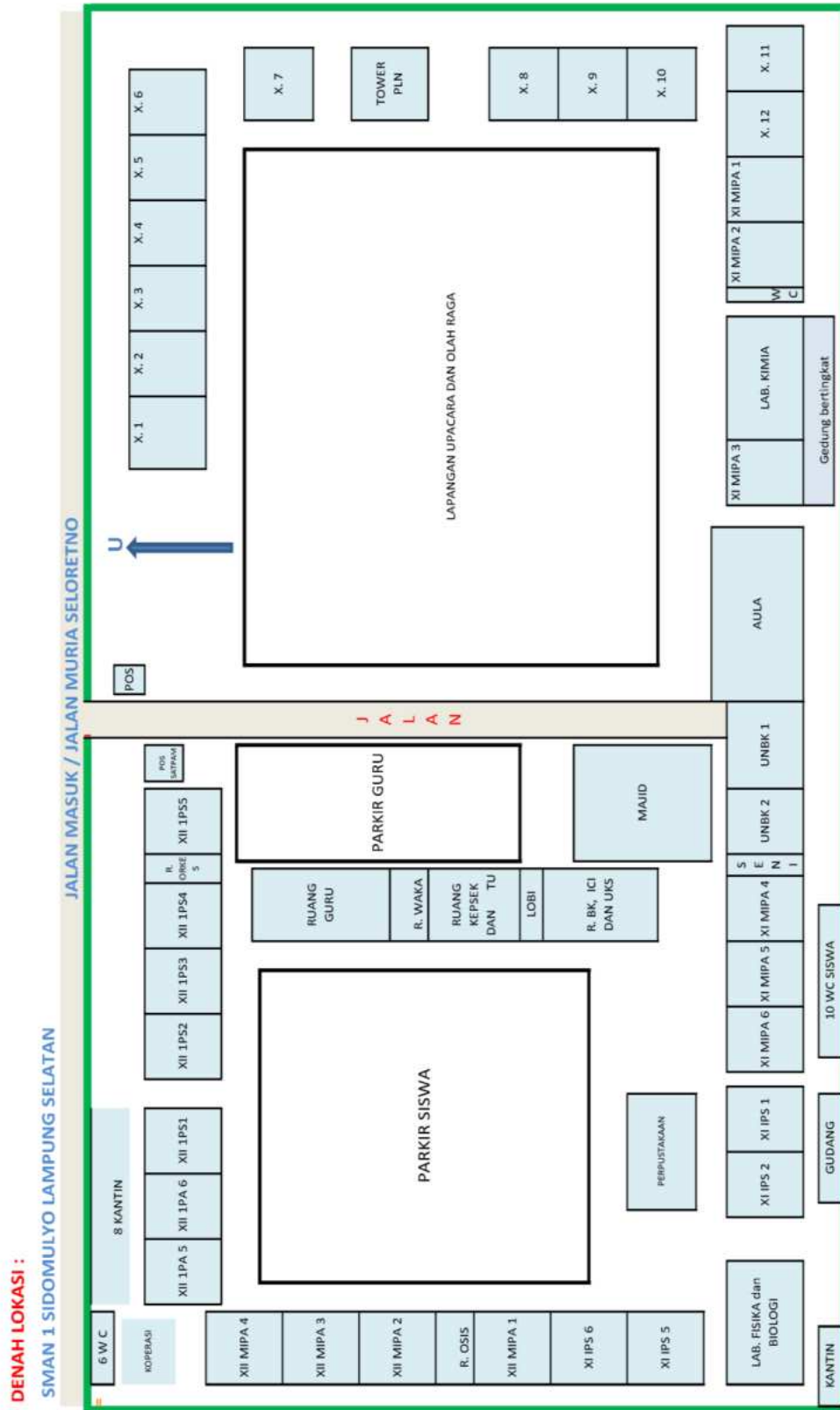
Gambar 1. Denah Ruang Belajar SMAN 1 Sidomulyo