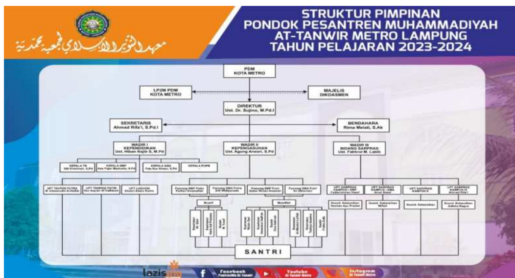
Gambar 4. Struktur organisasi Pondok Pesantren Muhammadiyah at-Tanwir Metro

Struktur Organisasi Pondok Pesantren Muhammadiyah at-Tanwir Metro 4