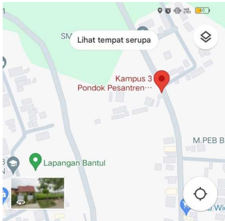
Gambar 3. Lokasi pondok pesantren muhammadiyah at tanwir kampus 3