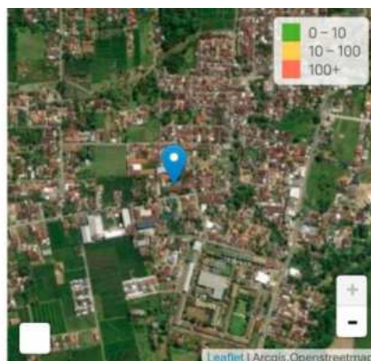
Gambar. 1. Gambar Lokasi Sekolah 3