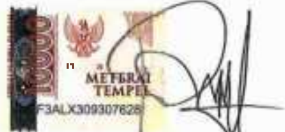
Liata Rifda NPM. 20420003