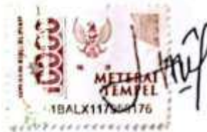
Lilis Insafiyatin NPM. 22720020

Metro, 16 Mei 2024 Yang membuat pernyataan,