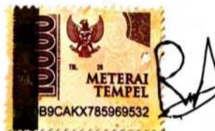
Muhamad Riduan 17520044