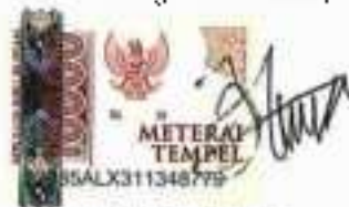
Asri Nalistia NPM. 20610042

Metro, 13 Agustus 2024 Yang membuat pernyataan