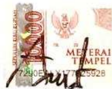
Agus Setiawan NPM. 17610001