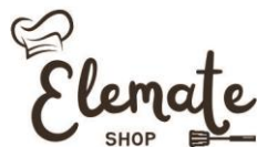
Gambar 2. Logo Elemate Shop

Elemate Shop dapat ditemui di Facebook dengan username Elemate Shop, di TikTok dengan username @elemate_, Instagram dengan username @elemate_shop, Shopee dengan nama toko Elemate Shop, dan alamat website https://elemateshop.my.id . Nama Elemate sendiri diambil dari kata elemen dan kata mate yaitu istilah dalam bahasa inggris yang umum digunakan untuk menyatakan sebuah keakraban, sedangkan elemen sendiri memiliki arti zat sederhana (tunggal) dan dianggap sebagai komposisi bahan alam semesta (udara, tanah, air, dan api), sehingga Elemate memiliki arti filosofis sebuah tim yang memiliki latar belakang berbeda dan memiliki kemampuan (spesialisasi) yang berbeda sehingga jika disatukan akan menjadi sebuah tim yang hebat. Berikut logo yang dimiliki oleh Elemate Shop: