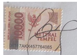
Rina Yati NPM.21720010