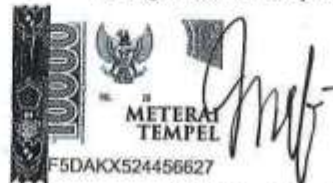
Mefilia Yunita NPM. 21720009