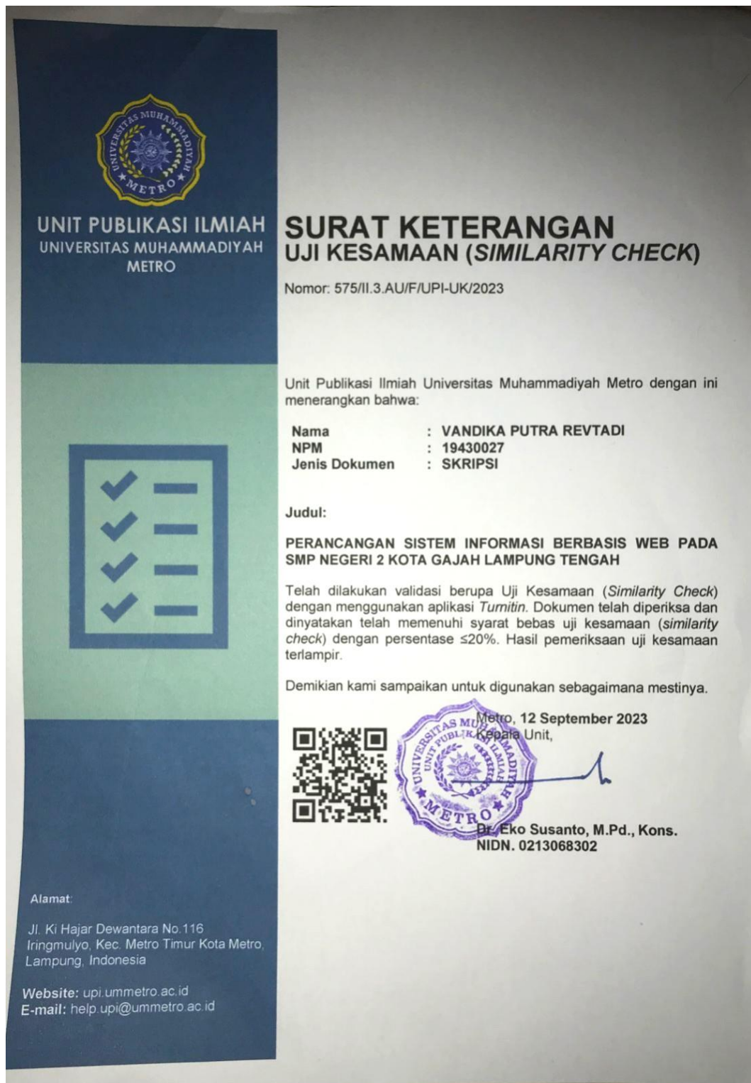
FOTO SERTIFIKAT UPI