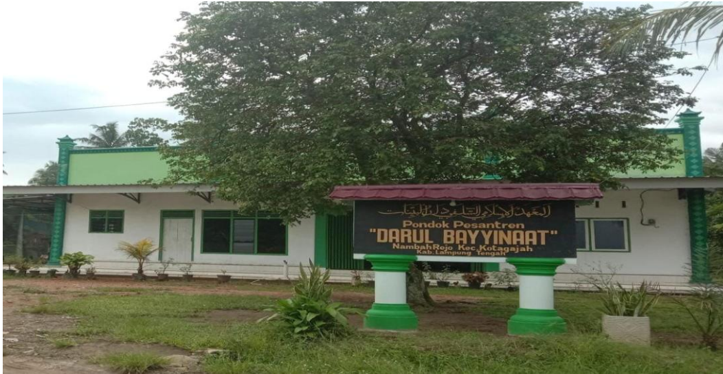
Gambar 6. Lokasi Pondok Pesantren Darul Bayyinat