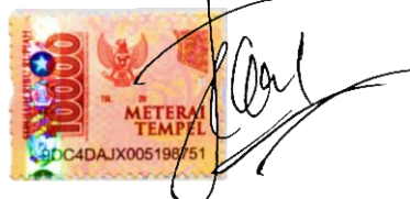
Dewi Astuti NPM. 19130022

Metro, 05 September 2023 Pembuat Pernyataan