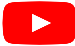
Gambar I. Logo Youtube