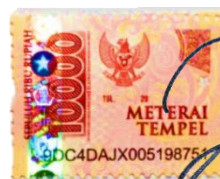
Khulli Yatur Rofingah NPM. 19210029