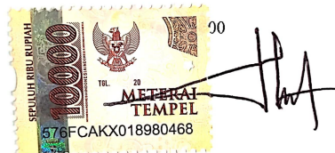
HASANUDIN NPM: 18250012