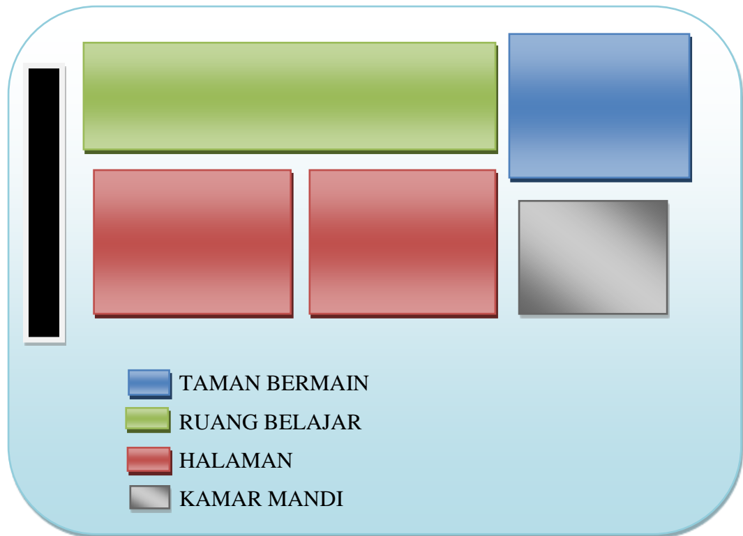
Gambar 4. Denah Sekolah