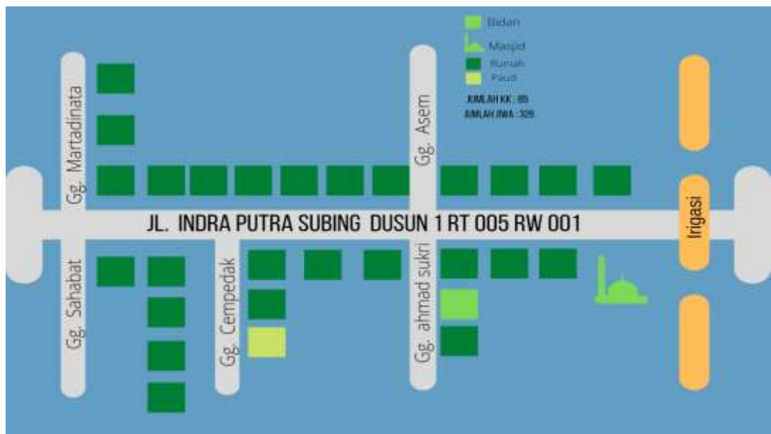
Gambar 3. Lokasi penelitian

Desa Indra Putra Subing terdiri dari 7 dusun. peneliti berada di wilayah dusun I Desa Indra Putra Subing berada di gang Cempedak.