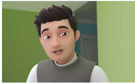
Gambar 3.5 Profil Ayah