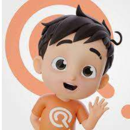
Gambar 3.1 Profil Riko

dan menggemaskan dalam pembawaannya. Selain itu Riko merupakan anak kecil yang memiliki sifat jahil. Ia selalu bertanya apapun yang tidak ia ketahui. Tokoh Riko tersebut disajikan dalam gambar 1.