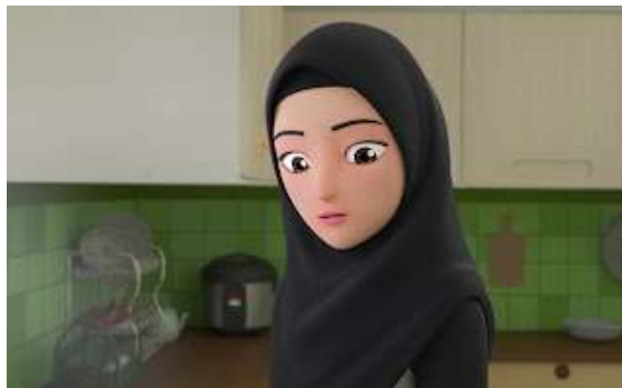
Gambar 3.4 Profil Bunda