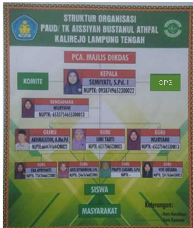
Gambar.5 Struktur Organisasi TK ABA Kalirejo