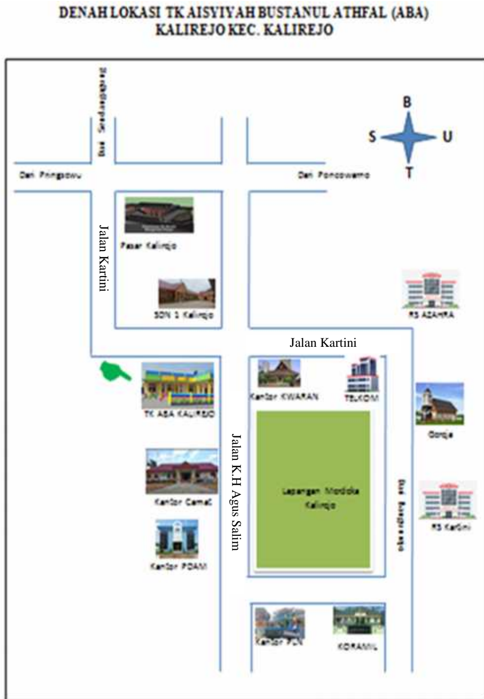
Gambar.2 Denah Lokasi TK ABA Kalirejo