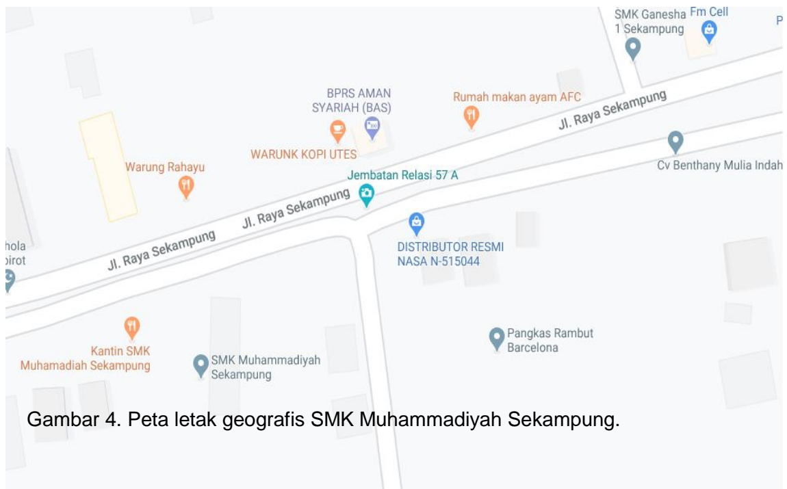
Gambar 4. Peta letak geografis SMK Muhammadiyah Sekampung.

Jika dilihat melalui layanan Google Maps , maka akan tampak terlihat bagaimana peta lokasi pada SMK Muhammadiyah Sekampung, Lampung Timur.