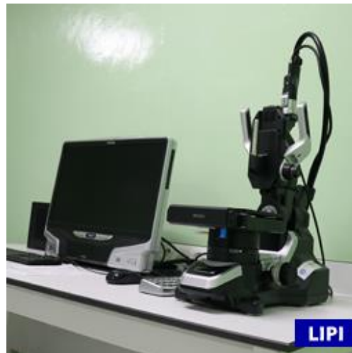
Gambar 14. Mikroskop optik

Mikroskop Optik adalah alat yang digunakan untuk melihat/mengukur kedalaman karbon yang masuk hingga dapat mengetahui ketebalan difusi dengan spesifikasi pembesaran 100-1000 kali