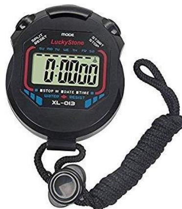
Gambar 17. Stopwatch

Digunakan sebagai alat pencatat waktu yang telah ditentukan pada saat proses penelitian berlangsung.