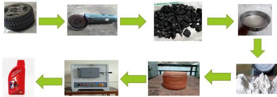
Gambar 24. Proses carburizing

Setelah tahap persiapan maka dilakukan tahap pengerjaan. Sprocket imitasi di potong – potong kecil berbentuk kotak dengan gerinda lalu di amplas dengan amplas kasar dengan nomer 100 lalu di amplas dengan amplas sedang nomer 500 lalu di amplas dengan amplas halus dengan nomer 2000 setelah itu arang kayu jati di tumbuk hingga halus setelah itu di ayak menggunakan ayakan mesh 100 setelah itu sprocket yang sudah di amplas di timbang berapa beratnya lalu di masukkan ke kotak sementasi bersama dengan arang kayu jati 90% dari berat sprocket dan barium karbonat 10% dari berat material kotak sementasi lalu dipanaskan menggunakan dapur pemanas dengan temperatur 800°C, 850°C, dan 900°C dengan masing-masing waktu penahan 1 jam, 1,5 jam, dan 2 jam, kemudian didinginkan dengan di celupkan ke oli.