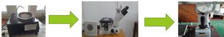
Gambar 25. Proses pengujian kekerasan dan difusi

Setelah sprocket selesai dilakukan proses pack carburizing , maka dilakukan pengujian pada material tersebut. Pengujian yang dilakukan adalah pengujian kekerasan yang dilakukan di laboratorium Teknik Mesin Kampus 2 (dua) Universitas Muhammadiyah Metro dan LIPI LAMPUNG