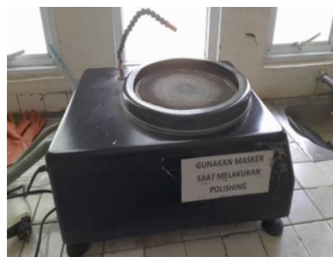
Gambar 13. Polishing machine unipol 1210