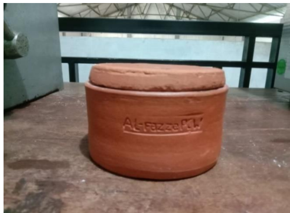
Gambar 15. Wadah Sementasi

Tempat menimbun Sprocket imitasi dengan arang kayu jati dan katalis pada saat proses karburasi dengan spesifikasi tahan panas tidak pecah terkena suhu tinggi dan tutupnya rapat