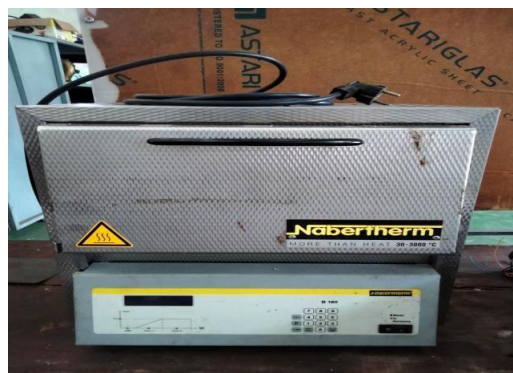
Gambar 11. Furnace

Sebagai tungku pemanas pada proses karburasi selama waktu 1 jam, 1,5 jam dan 2 jam dengan masing-masing temperature 800OC, 850OC, dan 900OC. dengan tipe L5/11/B180 serta spesifikasi tungku perendam 5 Liter dan suhu 1100oC tungku pembakar