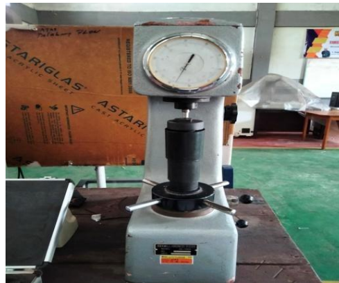
Gambar 12. Alat Uji Kekerasan Rockwell

dengan spesifikasi rentang pengukuran 20-70HRC, dengan kekuatan uji 60, 100, dan 150 Kgf