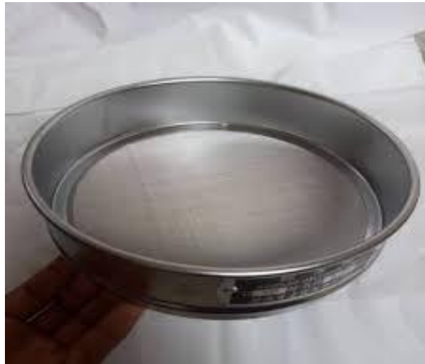
Gambar 18. Ayakan Mesh 100

Digunakan untuk menyaring arang tempurung kelapa yang sudah di tumbuk dengan spesifikasi 1 inci berlubang 100 dan bahan kuat tidak mudah renggang pada ayakannya