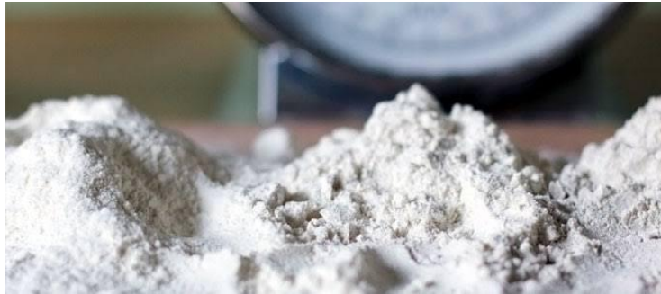
Gambar 22. Barium Carbonate

pack carburizing di dalam furnace . Katalisator yang digunakan biasanya Sodium Carbonat atau Barium Carbonate .