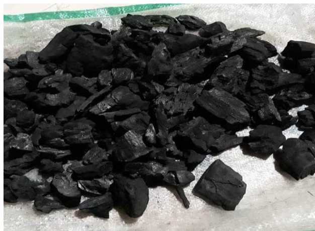
Gambar 21. Arang kayu jati

Sumber karbon aktif pada proses pack carburizing yang digunakan adalah arang kayu jati.