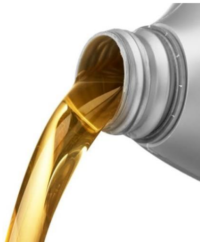
Gambar 23. Oli SAE 20W

Media pendingin yang di gunakan yaitu oli dengan SAE 20W