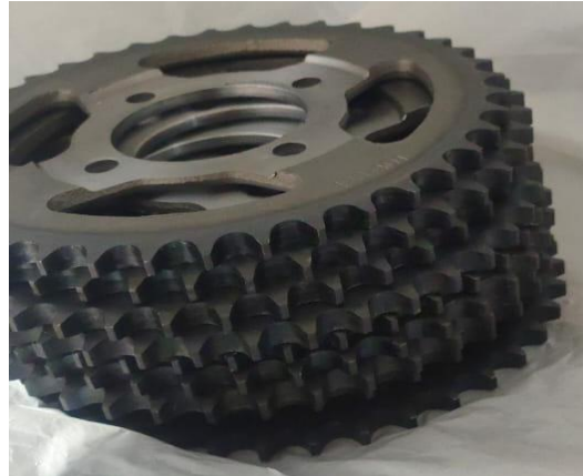
Gambar 20. Sprocket (Sumber : dokumen pribadi)

Sebagai bahan utama dalam penelitian ini dipilih adalah Sprocket imitasi. Nilai kekerasan dan struktur mikro pada benda tersebut akan diuji di laboratorium Teknik Mesin UM Metro. Pengujian ini akan dilakukan pada Sprocket imitasi yang dilakukan proses karburasi maupun tidak.