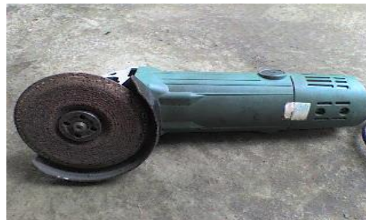
Gambar 16. Gerinda