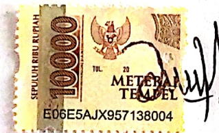
Della Safitri NPM.18810086