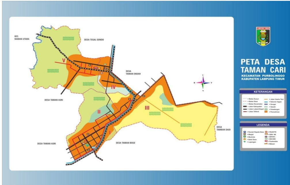
Gambar 1. Peta Desa Taman Cari. Dokumentasi, Desa Taman Cari, Taman Cari, 7 Maret 2022.