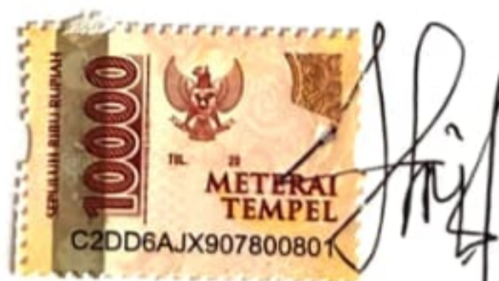
Hilda Ferentia NPM. 18130007