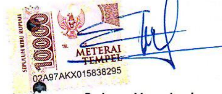
Sukma Hamdani NPM.18130016

Metro, 15 September 2022 Yang Membuat Pernyataan