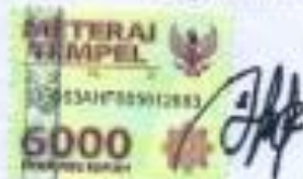
Sobirin NPM 16610086