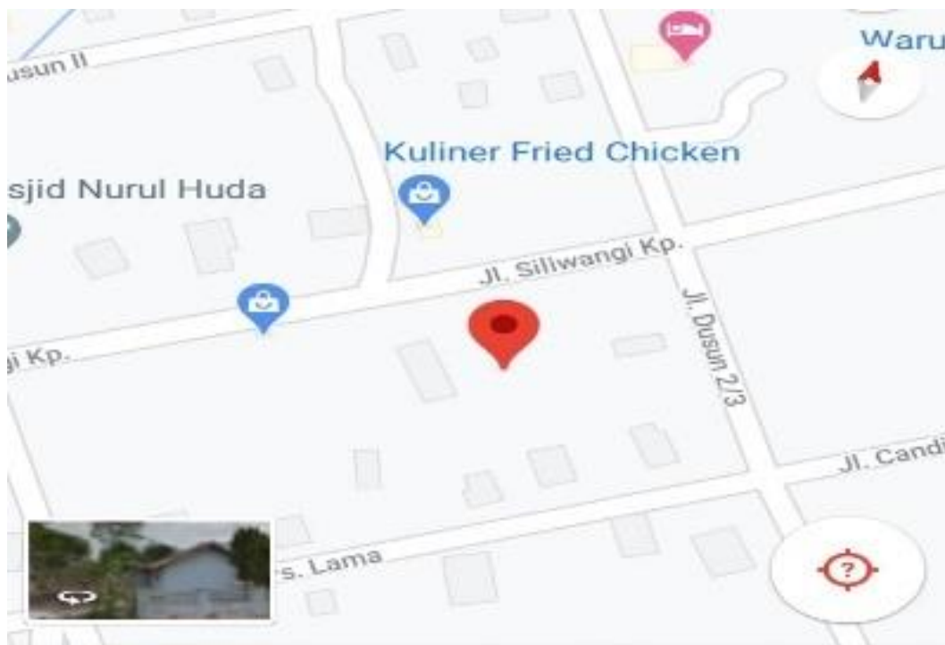
Gambar 5. Peta Letak Geografis TK Pertiwi Banjarkertahayu Kecamatan Way Pengubuan Kabupaten Lampung Tengah