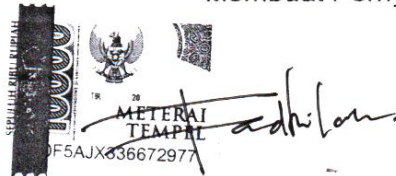
Uthi Fadhilah NPM.19720059