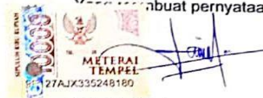
Aris Dwi Laksono NPM. 17630044